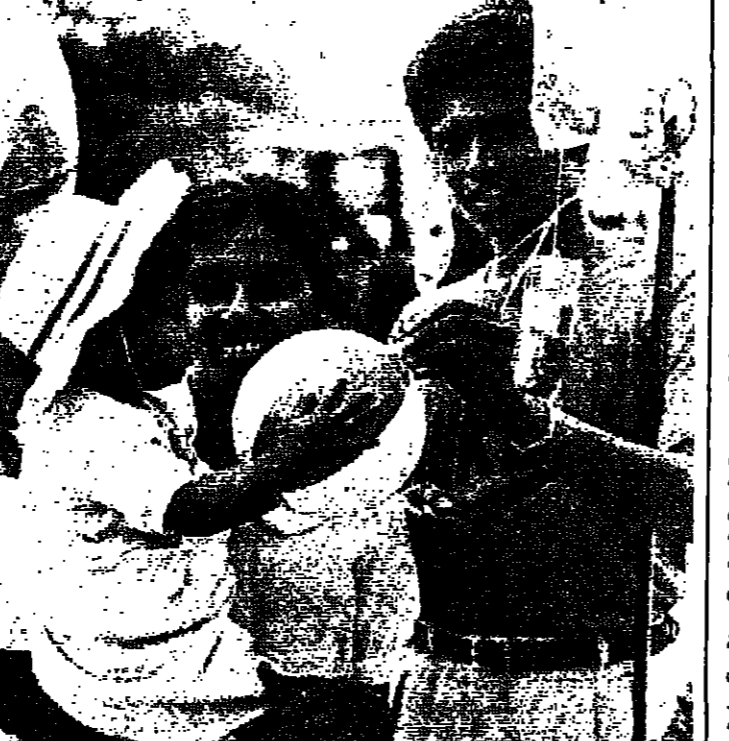
عودة الحياة الطبيعية الى ماثرا

صرح ناطق عسكري يان ثوار يساريين سريلانكيين مختبئين ان سبب اطلاق الجيش على الثوار في البلاد يتوون تعطيل انتخابات الشهر المقبل البرلمانية. وقال الناطق الذي كان يتحدث امس الاول في مقر قوات الامن في ماثرا التي تقع على مسافة ١٦٠ كيلومترا من الجنوب من كولومبو. انهم هناك ينتظرون الفرصة المناسبة. وقد يكون رفع حلة الحكومة قد اصحبت لقل من التدابير الامنية لم تعد مشددة كما كانت قديما. وكان يتحدث بعد بضع ساعات من قتل جبهة التحرير الشعبي، اليسارية سبعة اشخاص في جوارث منفصلة في جنوب البلاد. وقالت اتية ان معظم القتل هم من يقومون باعمال لها علاقة بالانتخابات. وهي الناطق يقول ان بائكان «جبهة التحرير الشعبي» ان تمديد جمع صوفاها وتسد ضرباتها ان بعد ان انسحبت القوات التي كانت تفتش